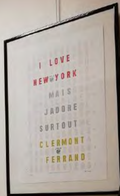
I love New York