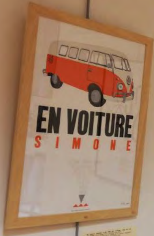
EN VOITURE SIMONE