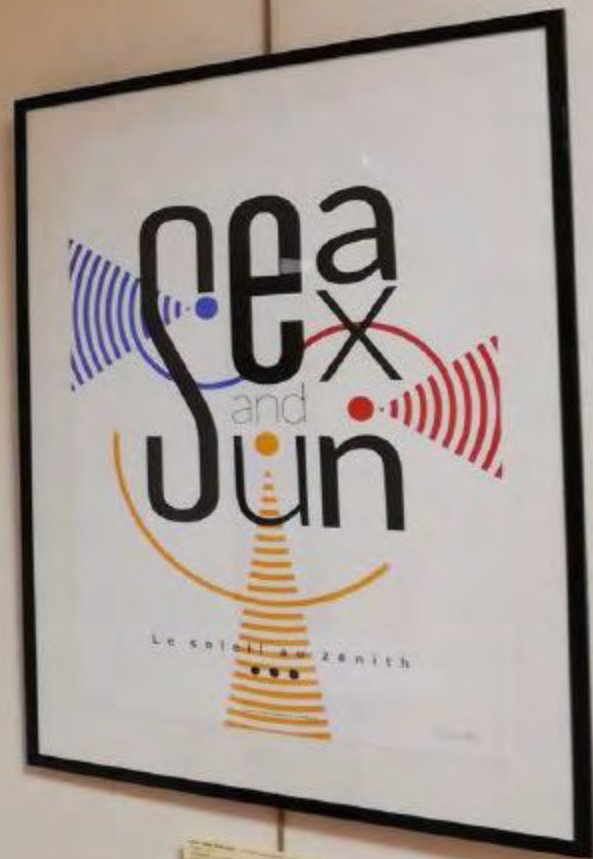
Le soleil au zenith