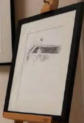
MPA BOIS LA MONTAGNE