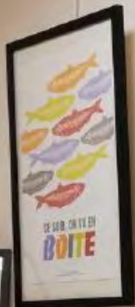
Ce sous chaque boîte