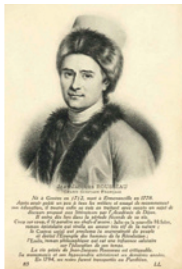
Carte postale, sans date. Le recto porte une biographie de Jean-Jacques Rousseau.

Cela pourrait s'appeler une biographie par la bande, une tentative de raconter les bords et les débords de la vie de Jean-Jacques avant qu'il ne devienne Rousseau, fragments ou franges d'existence de celui qui n'en est encore qu'à rêver d'être et qui ne sait pas vraiment ce qu'il deviendra : prêtre, maître de musique, précepteur, diplomate. Nous sommes dans les années 1730. Cela ne fait guère de doute : Jean-Jacques à vingt ans a plus d'un tour