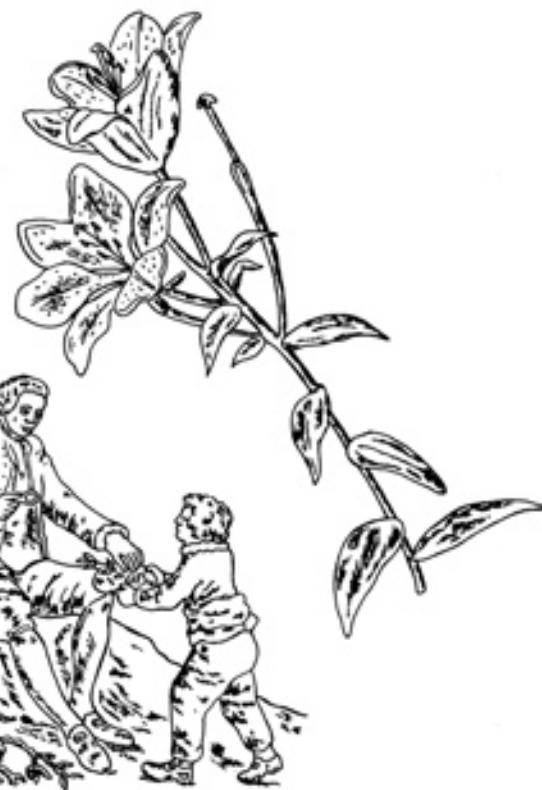
Illustrations de Géraldine Kosiak

Rousseau n'est pas, c'est à traits si grossiers qu'on le campe, le bonhomme doux, compréhensif, cajolant les enfants de ses hôtes – qui distribue des pommes, des oublies –, pas seulement ce botaniste courbé sur de volumineux herbiers ou prodiguant avis et conseils à ses correspondantes qu'une imagerie quasi sulpicienne voulut populariser. Il est ce cri. Cette indignation qu'aucun baume n'apaise, cet homme comme ce gamin meurtri devant qui les portes, celles de Genève, de Dieu quand tout parut consommé, se refermèrent, le vouant à la vie