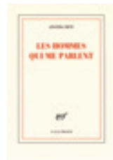
Ananda Devi Les Hommes qui me parlent Gallimard 224 p., 16,90 € ISBN 978-2-07-013440-3