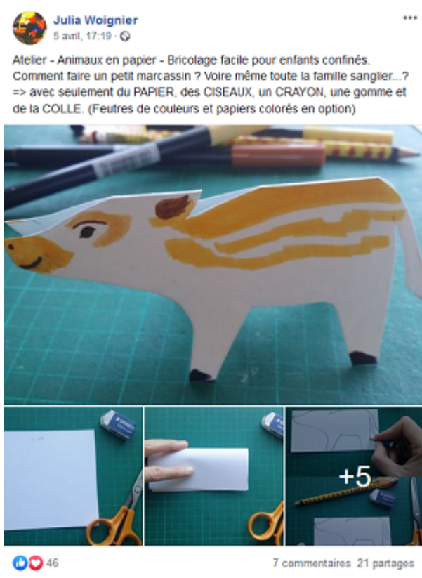
Exemple des animaux à bricoler proposés par Julia Woignier