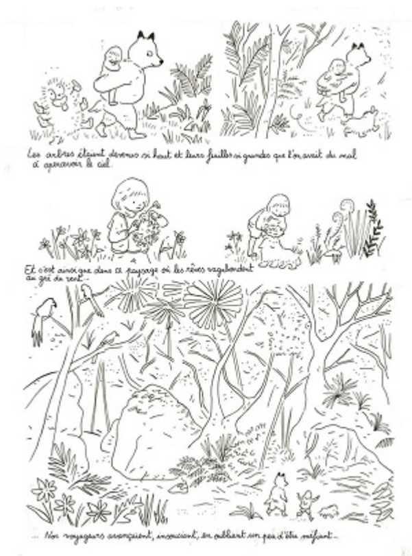
Une des planches proposées par Camille Jourdy