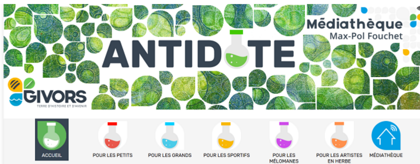
Antidote, les recommandations de la médiathèque de Givors pour tous