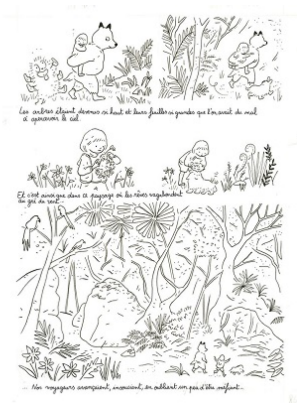
Une des planches proposées par Camille Jourdy