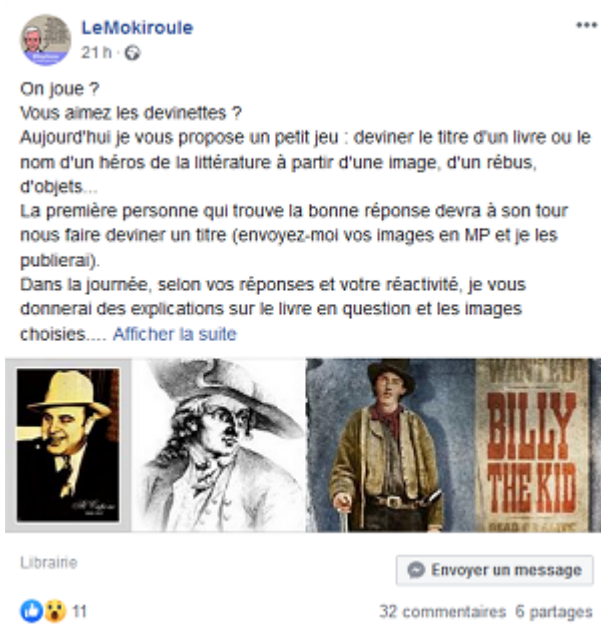
Exemple du jeu proposé par la librairie Le Mokiroule