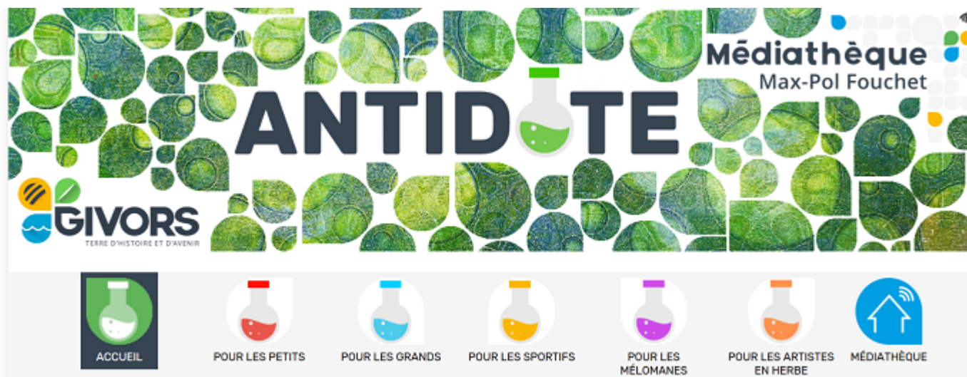
Antidote, les recommandations de la médiathèque de Givors pour tous