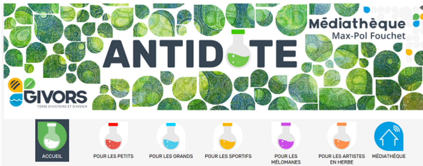
Antidote, les recommandations de la médiathèque de Givors pour tous