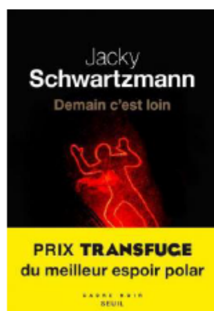
Jacky Schwartzmann Demain c'est loin Éditions du Seuil