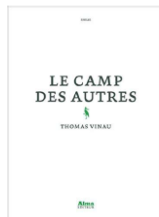
Thomas Vinau Le Camp des autres Alma éditeur