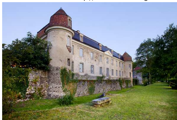
Vue du Château de Goutelas

Pour plus d'informations : http://www.chateaugoutelas.fr